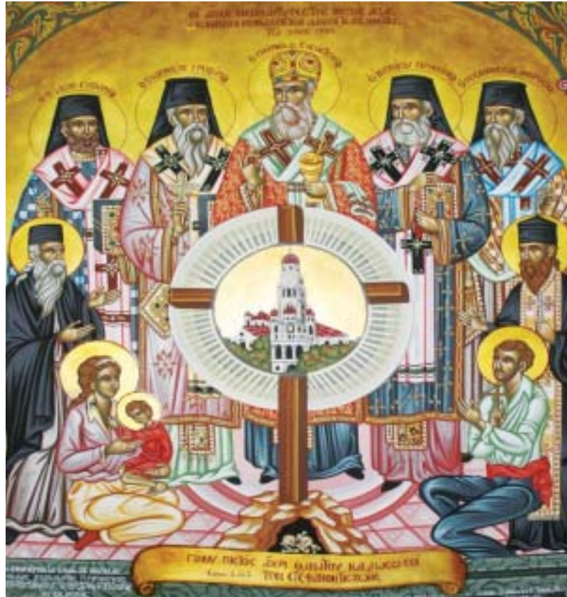
Ἅγιοι Νεομάρτυρες τῆς Μικρᾶς Ἀσίας: ἱεράρχες, ἱερεῖς, μοναχοί καί λαϊκοί, ἄνδρες, γυναῖκες καί παιδιά. Ὁ Σταυρός στό κέντρο τῆς εἰκόνας συμβολίζει τή «Σταυρωμένη Μικρά Ἀσία». Τό Καμπαναριό στό κέντρο ἀναπαριστᾷ τό Καμπαναριό τῆς Ἁγίας Φωτεινῆς Σμύρνης.

Ὁ Νεομάρτυρας Εὐγένιος, ἀδελφός τοῦ Μητροπολίτη Σμύρνης Χρυσόστομου, ἀφοῦ συνελήφθη ἀπό τοὺς Νεοτούρκους κρατήθηκε φυλακισμένος ἐπὶ 6 μῆνες καί τέλος τόν ἀπαχόνισαν τόν Φεβρουάριο τοῦ 1923.