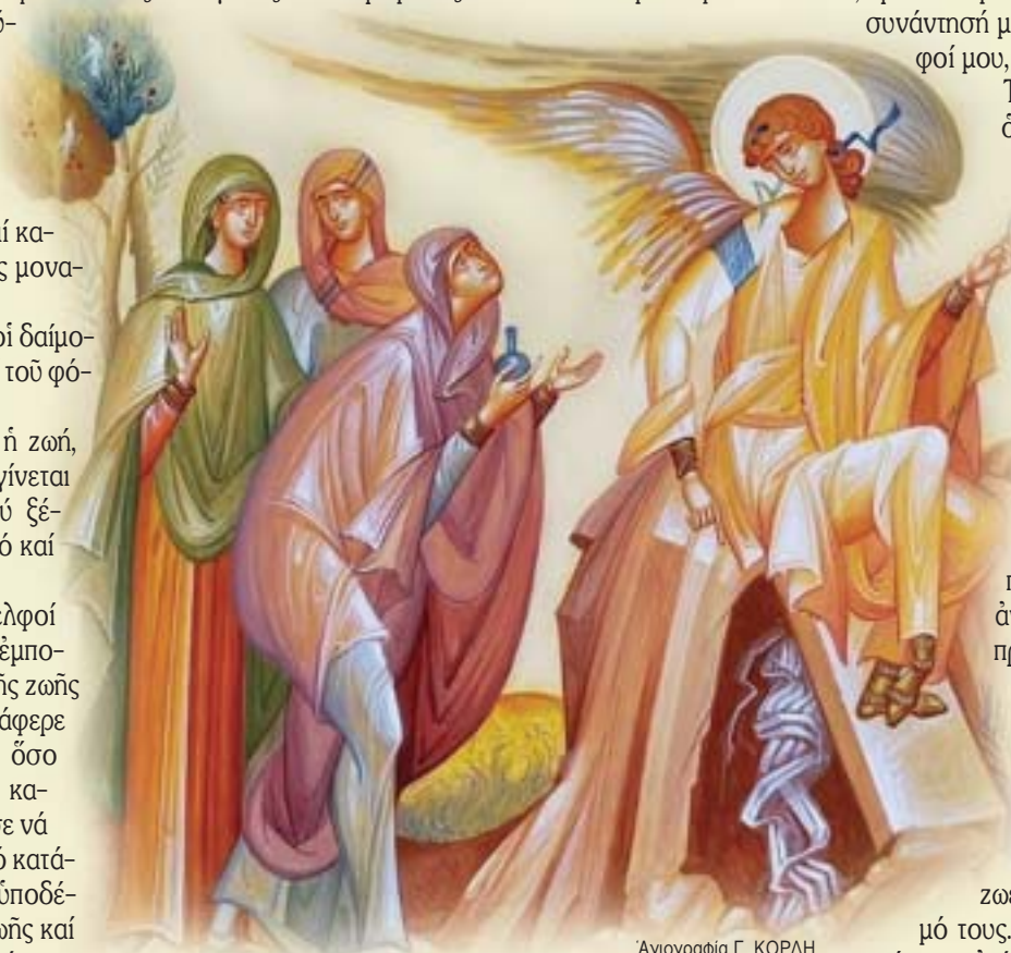
Ἄγιογραφία Γ. ΚΟΡΔΗ.