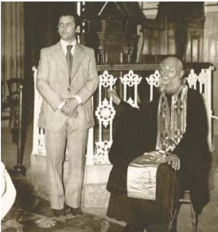
Πρωτοψάλτης στὴν Πανιάνασσα Πατρῶν, 1972-1973.

Δ ικαίων δὲ ψυχαὶ ἐν χειρὶ Θεοῦ, καὶ οὐ μὴ ἄψνται αὐτῶν βάσανος... καὶ γὰρ ἐν ὄψει ἀνθρώπων ἐὰν κολασθῶσιν, ἡ ἐλπίς αὐτῶν ἀθανασίας πλήρης· καὶ ὀλίγα παιδευθέντες μεγάλα εὐεργετηθήσονται, ὅτι ὁ Θεὸς ἐπέειρασεν αὐτοὺς καὶ εὗρεν αὐτοὺς ἀξίους ἑαυτοῦ· ὡς χρυσὸν ἐν κωνευτηρίῳ ἐδοκίμασεν αὐτοὺς καὶ ὡς ὀλοκάρπωμα θυσίας προσεδέξατο αὐτούς. Καὶ ἐν καιρῷ ἐπισκοπῆς αὐτῶν ἀναλάμπουσι καὶ ὡς σπινθῆρες ἐν καλάμῃ διαδραμοῦνται (Σοφ. Σολ. 3, 1-7).