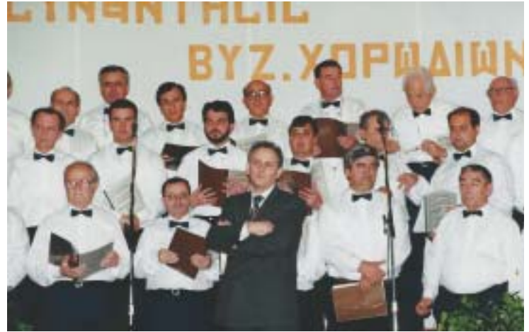
Χοράρχης τῆς Χορωδίας Ἱεροψηλῶν Βόλου, 1992.

Μέσα στόν θεῖο αὐτό Χορό εἶθε καί ὁ μακάριος νά καταταχθεῖ, ἐνώνοντας τή φωνή του μέ αὐτές τῶν Ἀγγελικῶν Δυνάμεων, ὑμνολογώντας στήν Οὐράνια Θεία Λειτουργία τόν Κύριο τῆς Δόξης, τόν Ὅποιον παιδιόθεν ἀγάπησε καί ὑπηρετήσε ἐδῶ στή γῆ. Καί Ἐκεῖνος, ὁ πρωτότοκος τῶν νεκρῶν, ὁ Ὡν καί ὁ Ἦν καί ὁ Ἐρχόμενος, νά τόν