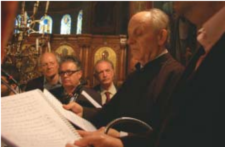
Στό ἀναλόγιο τοῦ Μητροπολιτικοῦ μας Ναοῦ.

Ὡς τελευταία του πολύτιμη ἀποσκευή ἔφερε τό ὕστατο ἄθλημα τῆς ὀδυνηρῆς ἀσθενείας, στό ὁποῖο ἀγωνίσθηκε μέ θαυμαστή καρτερία, γενναιότητα καί δοξολογική διάθεση, ζητώντας τίς προσευχές ὄλων καί «ἀφορῶν εἰς τόν τῆς πίστεως ἀρχηγόν καί τελειωτήν Ἰησοῦν». Ἐνῆλθε τόν Γολγοθά του μέ θάρρος, τό ὁποῖο ἀντιλοῦσε ἀπό τήν ἀκράδαντη πίστη καί ἐλπίδα του στόν Ἀναστάνα Χριστό. Δίδαξε μέ τό παράδειγμά του τήν πνευματική ἀνδρεία, τήν ἰληρή ὑπομονή, τήν