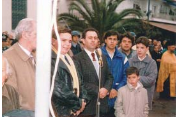
Θεοφάνεια σπὴν παραλία τοῦ Βόλου, 1986.

Και μετὰ, ὁ ὑπερκόσμιος γινόταν προσπνής καὶ ἀνθρώπινος, στοργικὸς μὲ τὰ παιδιὰ του, τρυφερός μὲ τὰ ἐγγόνια του, πρό-