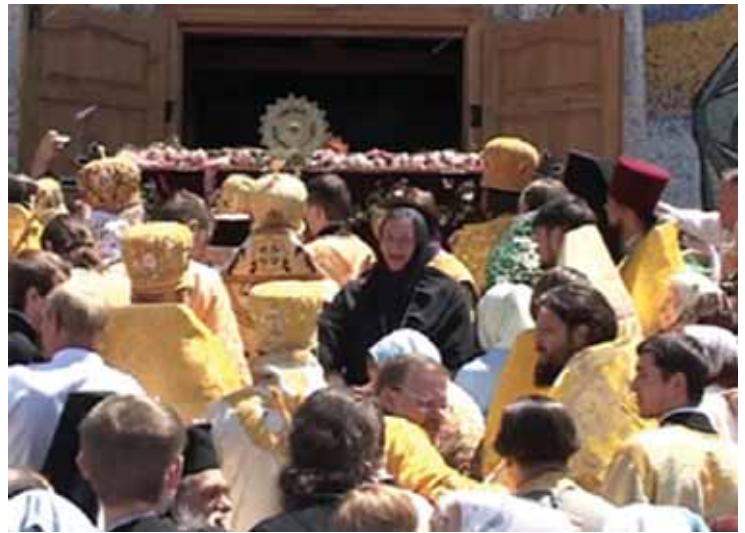
Άπό την λιτανεία τής λάρνακας του Άγιου Λουκά κατά την ήμέρα τής έορτής του (11 Ιουνίου) στον περίβολο τής Ίερής Μονής Άγίας Τριάδος- Άγιου Λουκά στην Συμφερούπολη τής Κριμαίας.

Ό Άγιος Αρχιεπίσκοπος Λουκάς (Βαλεντίν Βόινο-Γιασενέτσκι) έζησε μέσα σε ένα καθεστώς έχθρικό προς κάθε θρησκεία αλλά και έλευθερία. Πάλεψε ως ιατρός και άπλός πολίτης σε δύο Παγκόσμους Πολέμους, κινήματα και επαναστάσεις. Τά βάσανα, οί φυλακές τής Υπέρ Σιβηρίας και τό πολικό κρύο θά έπρεπε νά τόν είχαν σκοτώσει δεκάδες φορές. Και, όμως, μέσα σε όλο αυτό τό άπόλυτο χάος ένας άνθρωπος στάθηκε όρθιος στην καταφορά τής ζωής και άποτελεί ένα παγκόσμιο φαινόμενο, άπόλυτα καταγεγραμμένο. Και μόνο τό γεγονός τής επιβίωσής του σε τόσο άκραίες συνθήκες επί μñνες, θά πρέπει νά άποδοθει σε σωρεία θαυματουργικών παρεμβάσεων. Έλάχιστες φορές στην Νεώτερη