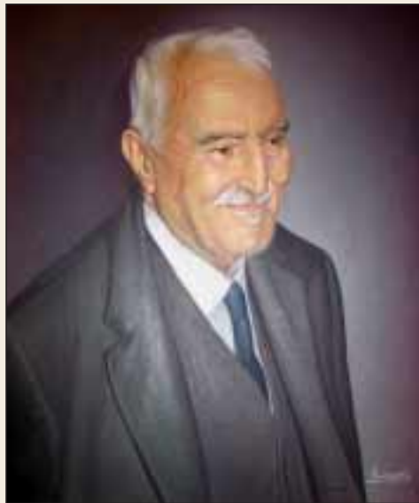
Ὁ ἀείμνηστος Καθηγητής Παναγιώτης Τρεμπέλας.

Ε ὐχαριστῶ θερμά, λίαν ἀγαπῆτέ μου π. Ἰγνάτιε, Ἁγίε Δημητριάδος & Ἀλμυροῦ. Μέ τιμᾶ καί μέ συγκινεῖ ἡ ἀνάθεση τῆς ἀναφορᾶς στήν «ἐκκλησιαστική πνευματική καί ἐπιστημονική διαδρομή» τοῦ μακαριστοῦ Π. Ν. Τρεμπέλα, ὅπως λιτά ἐπιγράφεται σέ ὅλα τά βιβλία του ὁ ἀγαπημένος εὐρύτατα Καθηγητής τῆς Θεολογικῆς Σχολῆς τοῦ Πανεπιστημίου Ἀθηνῶν καί «ᾠριγενείων διαστάσεων» συγγραφέας, πρῖν καί πέρα ἀπό ὅλα, συν-ἰδρυτικό καί ἐξέχον μέλος, 53 χρόνια τῆς Ἀδελφότητας Θεολόγων «ἡ Ζωή», τό ἴδιο ἄλλα 17 τῆς ἀντίστοιχης, τοῦ «Σωτήρα».